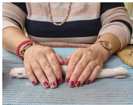
Válení filcu v plátně