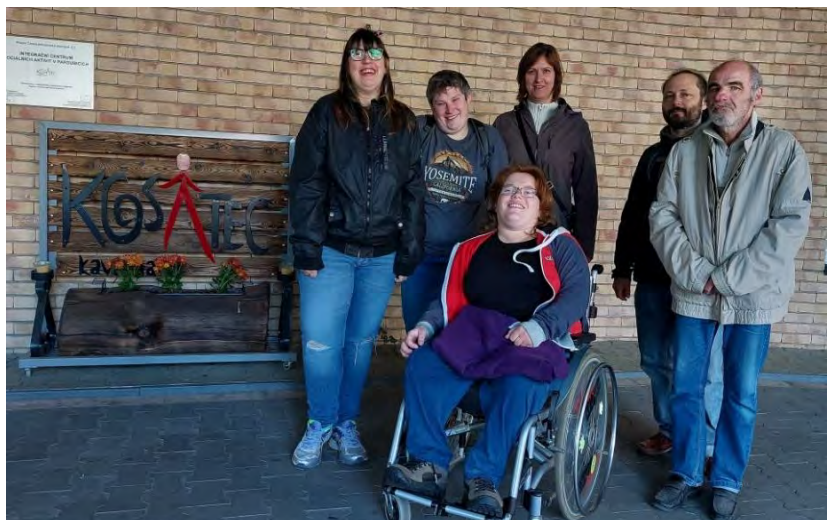
Na návštěvě v pardubickém Kosatci.

Uživatelé navštěvují dílnu pravidelně podle svého přání nejméně 2x týdně. Během roku sociální službu využívalo 18 osob. A za loňský rok může dílna vykázat 1769 osobodnů, 7960,5 osobohodin. Dílna byla otevřená celkem 244 dní v roce. Přibližně jedna třetina klientů bydlí v DSS Slatiňany, třetina uživatelů dochází z rodin z Chrudimi a třetina dojíždí z okolních obcí.