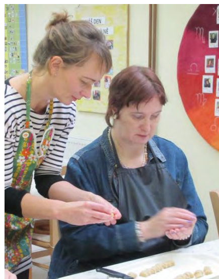
Kromě plstění se v STD věnujeme i přípravě jídla.

několika Individuálních projektů Pardubického kraje. Město Chrudim pravidelně podporuje i další naše aktivity: kulturně vzdělávací programy a jiné projekty.